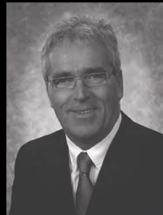
JACQUES BOILARD, auteur

Ce livre est un outil pédagogique essentiel pour bien comprendre les principes fondamentaux d'une enquête et établir les méthodes de travail de base pour la réaliser. Il vise également l'application des lois et réglementations existantes pour lutter efficacement contre les organisations criminelles actives et contrer éventuellement les activités de recyclage des produits de la criminalité. Il expose aussi tous les aspects et processus d'intervention de premier niveau visant à enrayer le commerce illégal de boissons alcooliques et l'exploitation illégale d'appareils d'amusement et de loterie vidéo ainsi que le commerce illégal du tabac.